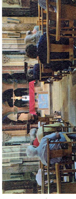
Bourbon l'Archambault (03)